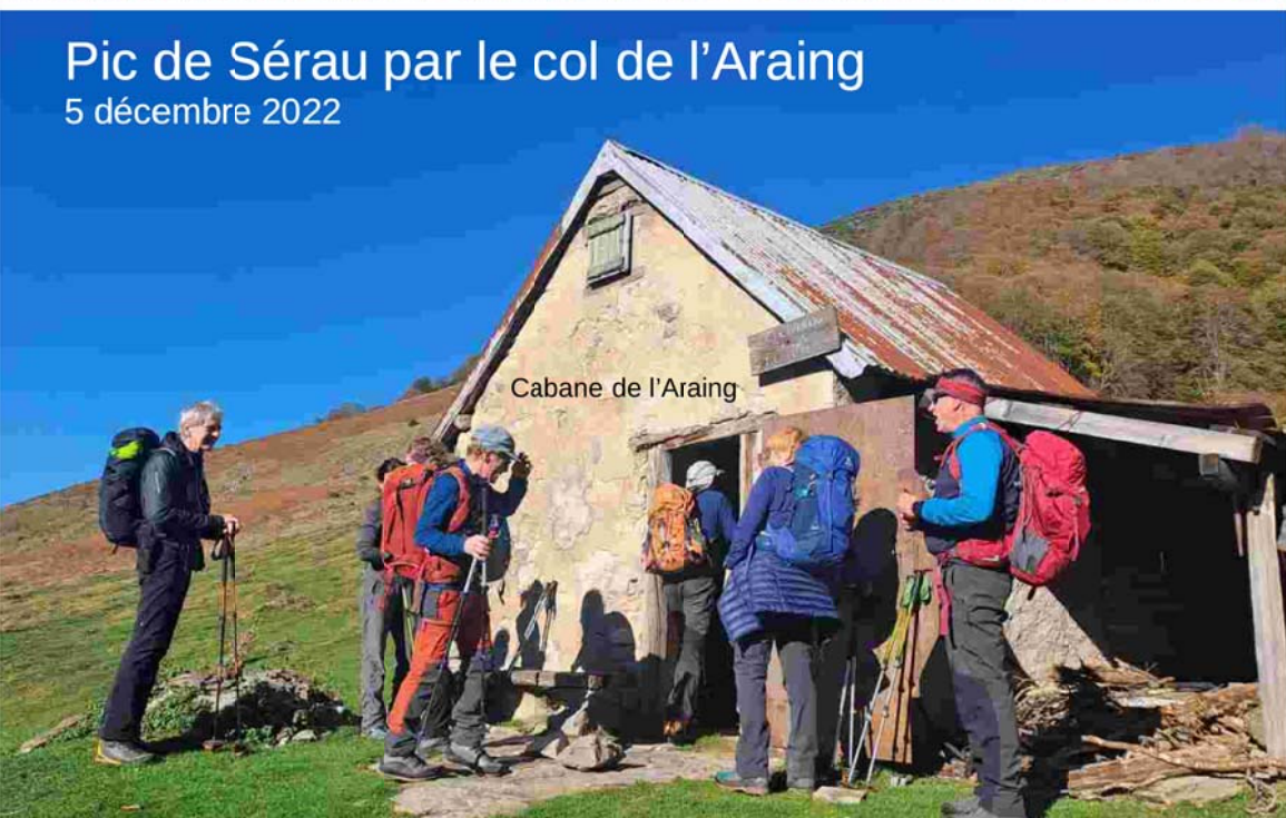
Pic de Sérau par le col de l'Araing 5 décembre 2022